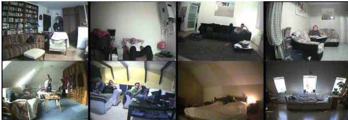
A Szabadulóművész apológiája, Temető - Budapest (2009)